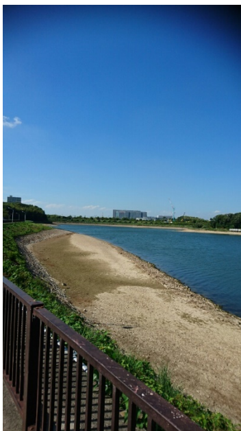
600m 付近からゴールの状況